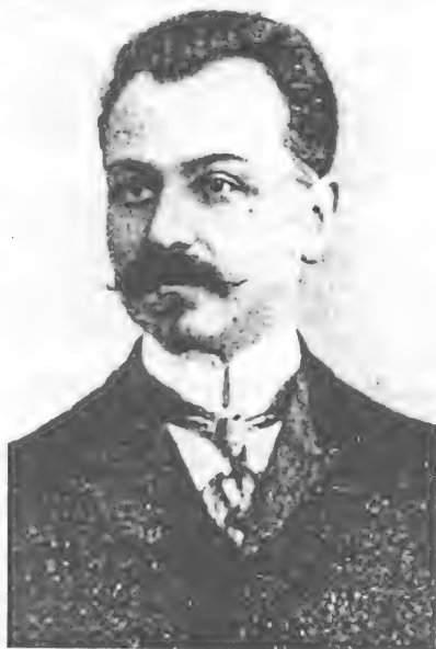
Фатали-хан Искендер-хан оглы Хойский (1875 – 1920)